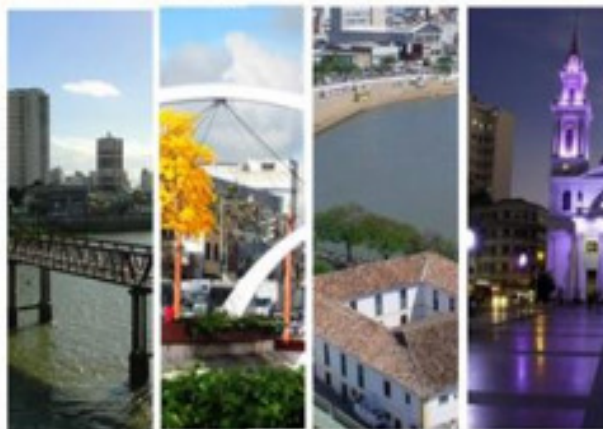
Olhares sobre a cidade de Campos dos Goytacazes

Palavras-chave: Literatura. Fotografia. Espaços urbanos. Interdisciplinaridade.